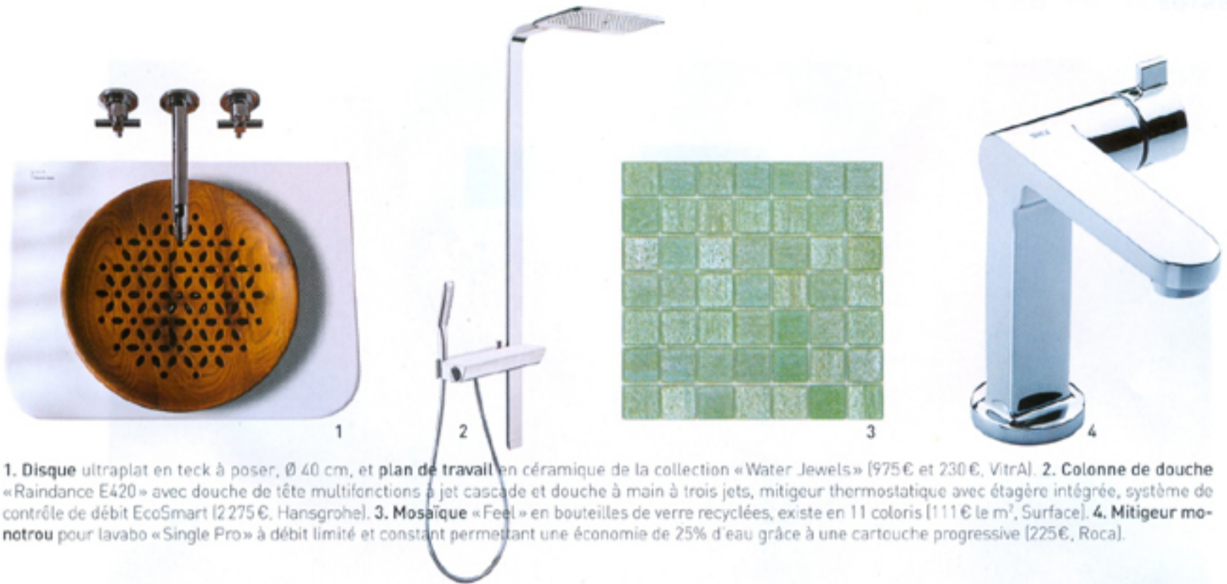
1. Disque ultraplat en teck à poser, Ø 40 cm, et plan de travail en céramique de la collection «Water Jewels» [975 € et 230 €, Vitra]. 2. Colonne de douche «Raindance E420» avec douche de tête multifonctions à jet cascade et douche à main à trois jets, mitigeur thermostatique avec étagère intégrée, système de contrôle de débit EcoSmart [2 275 €, Hansgrohe]. 3. Mosaïque «Feel» en bouteilles de verre recyclées, existe en 11 coloris [111 € le m 2 , Surface]. 4. Mitigeur monotrou pour lavabo «Single Pro» à débit limité et constant permettant une économie de 25% d'eau grâce à une cartouche progressive [225 €, Roca].