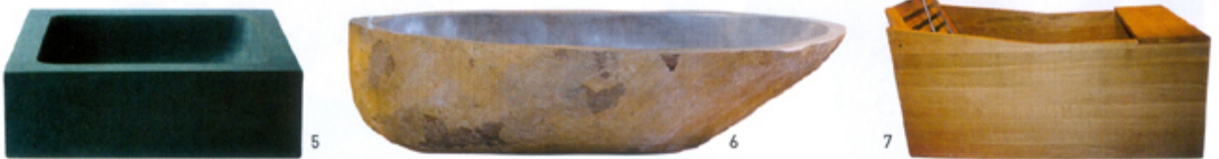
5. Vasque «Form Baltic» en granit poli gris, L 40 x P 40 x H 12,5 cm [259 €, Castorama]. 6. Baignoire en pierre «River Stone» réalisée dans un galet de rivière coupé en deux, creusé puis poli à la main, les dimensions, le poids et la couleur varient donc pour chaque pièce (prix sur demande, SDA Décoration). 7. Baignoire rectangulaire en cèdre rouge, à usage intérieur ou extérieur, L 150 x P 65 x H 65 cm [4 700 €, Pacific].