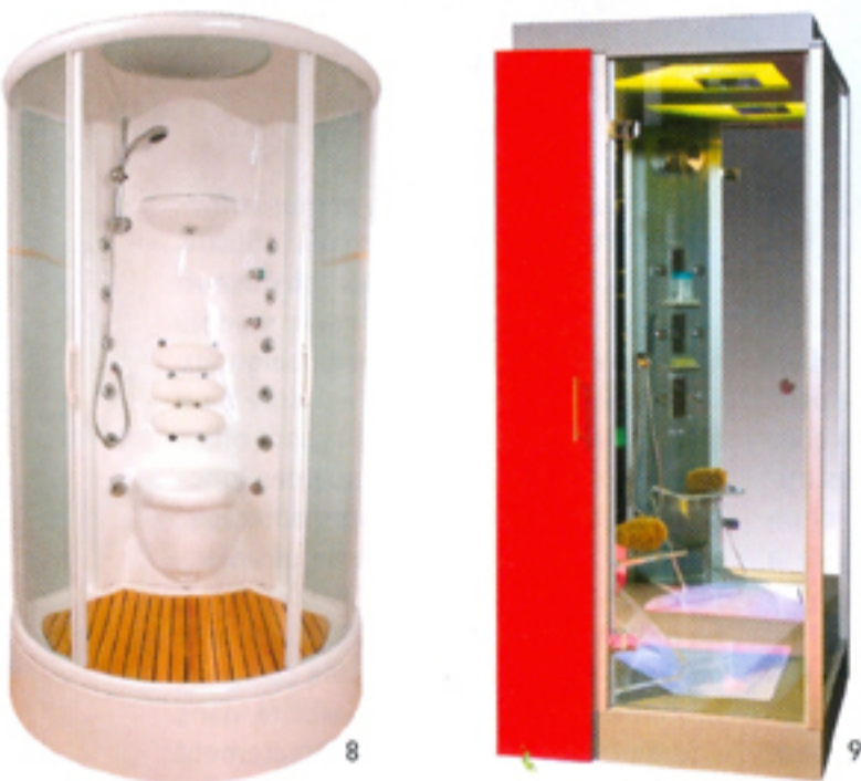
8. Cabine de douche à recyclage d'eau «Kinergy C» dotée de deux portes coulissantes en verre Securit 6 mm anticalcaire, 11 buses, 8 injecteurs et 4 jets à débit variable [3 533 €, Kinedo]. 9. Cabine de douche monobloc à recyclage d'eau «Zénia», 2 types de jets, fonction douche ou massage en recyclage (à partir de 9 500 €, Yves Pertosa).