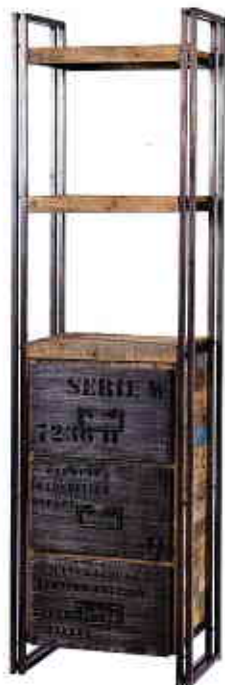
DR x 6

SECONDE VIE Chaise pliante, design Bernard Vuarnesson, en chêne récupéré d'anciens tonneaux. H 80 x L 43 x P 46 cm, « Tonello », Sculptures Jeux.