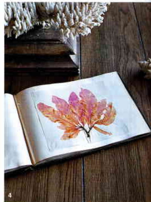
1 et 2. Herbarium régional des Pyrénées, regroupant des spécimens de montagne (edelweiss, raiponce orbiculaire, bruyère cendrée, cystoptéris des montagnes...). 3. Planches de lichens. 4. Dans un magnifique alguier, une algue Delesseria sanguinea , récoltée dans l'océan Atlantique au début du XX e siècle.