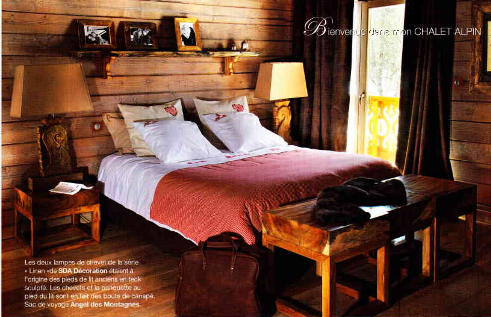
Les deux lampes de chevet de la série « Linen » de SDA Décoration étaient à l'origine des pieds de lit anciens en teck sculpté. Les chevets et la banquette au pied du lit sont en fait des bouts de canapé. Sac de voyage Angel des Montagnes.

de me glisser sous une double peau, je me sens protégé, les bruits sont sourds et il s'en dégage une extrême sérénité », ajoute joyeusement le propriétaire.