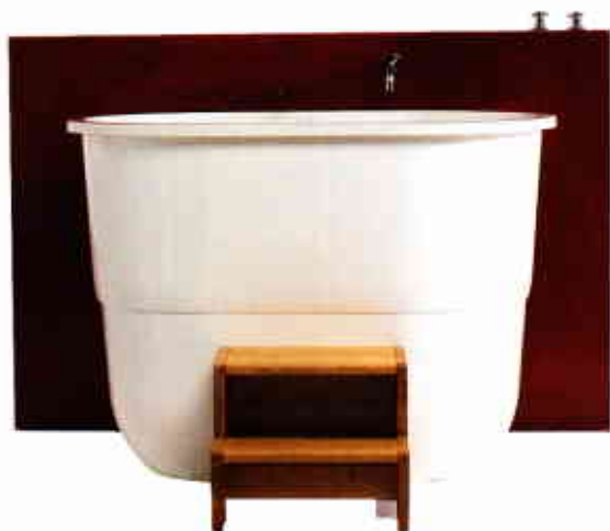
ORIENTALE. Baignoire baquet Sorrento en Quarrycast, inspirée de l'ofuro japonais traditionnel. À poser en îlot ou encastrée, à partir de 4 066 €, VICTORIA • ALBERT.

Des modèles singuliers, à faire trôner au milieu de sa salle de bains ou de sa chambre.