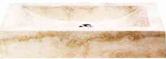
MINÉRALE. Vasque en travertin poli, coloris ivoire, 695 €, SDA DÉCORATION.

Elles adoptent des matières précieuses et des formes sculpturales qui en font des objets d'art.