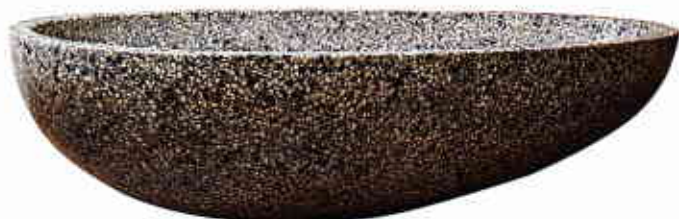
GALET. Baignoire en terrazzo, collection OO, à partir de 13 500 €, selon finitions, design Jirko Bannas, SOPHA INDUSTRIES.