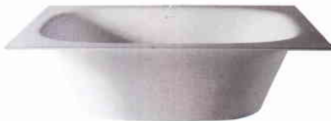
À L'ESSENTIEL. Sartoriale Maxi en Cristalplant, à partir de 8 775 €, design Carlo Colombo, ANTONIO LUPI.