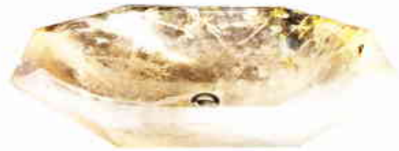
VEINÉE. Vasque Bijou en cristal de roche poli, taillé dans un bloc, prix sur demande, SDA DÉCORATION.