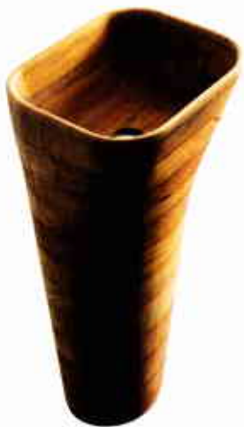
BOIS. Lavabo monolithe en bois d'iroko, 3695 €, GALASSIA chez DAVID B.