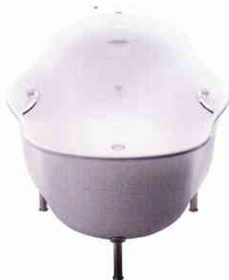
COURBES GÉNÉREUSES. Baignoire Furo en céramique, prix sur demande, design Toshiyuki Kita, INAX.