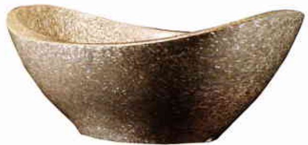
NACRÉE. Vasque habillée du revêtement Shellstone, disponible dans 12 coloris irisés, prix sur demande, ANTONIO LUPI.