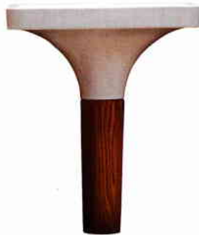
COROLLE. Vasque Tulip en céramique blanche et chêne, 1155 €, AZZURRA.