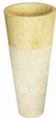
CONIQUE. Vasque Conico en pierre naturelle polie sur la partie supérieure de la vasque, et striée sur la partie inférieure, 790 €, IMSO chez DAVID B.