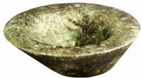
PRÉCIEUX. Lave-mains en résine avec inclusions de verre feuilleté et particules d'argent, 1375 €, CARRELAGE DES SUDS.